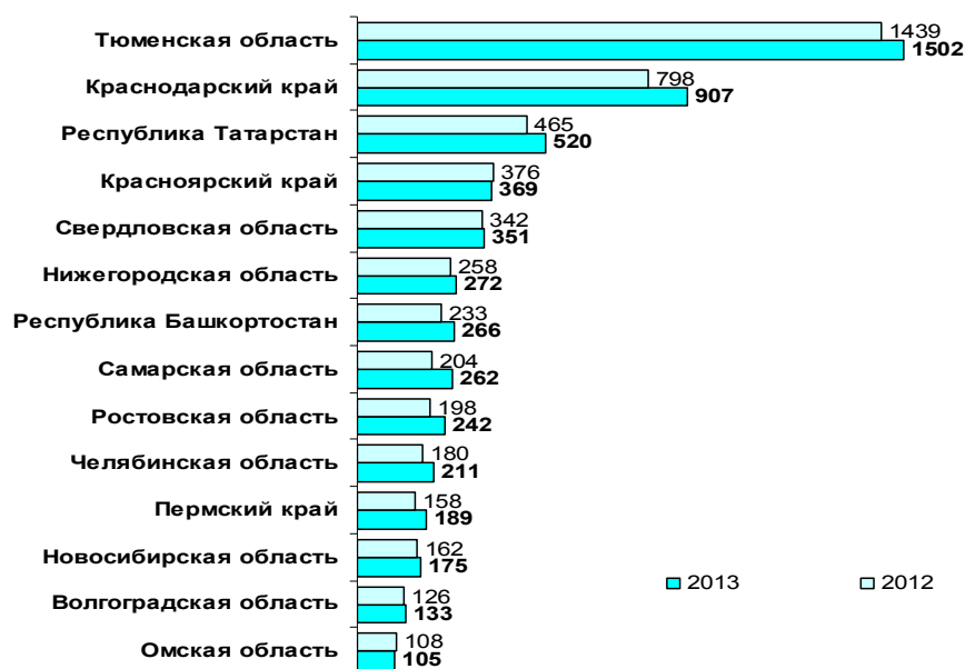
Рис. 5. Объем инвестиций в основной капитал 14 крупнейших регионов России в 2013 и 2012 гг.