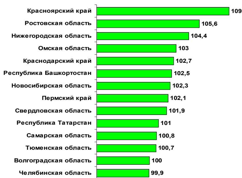
Рис 4. Индекс промышленного производства 14 крупнейших регионов России (2013 г. в % к 2012 г.).

В 2013 году в целом по России наблюдалась стагнация промышленности: индекс промышленного производства (ИПП) составил всего 100,3%. Замедление промышленного роста коснулось и большинства крупнейших регионов, принятых к сравнению (рис. 4). Наиболее существенное замедление наблюдалось в Свердловской области, в которой ИПП сократился на 7,7 п.п. и составил 101,9% (против 109,6 в 2012 году). Также ощутимое замедление наблюдалось в Новосибирской области (-6,7 п.п.), Республике Татарстан (-5,9 п.п.), Краснодарском крае (-5,6 п.п.), Волгоградской области (-4,8 п.п.). Лидером роста стал Красноярский край (109%). Стагнация промышленного производства наблюдалась в Челябинской и Волгоградской областях.