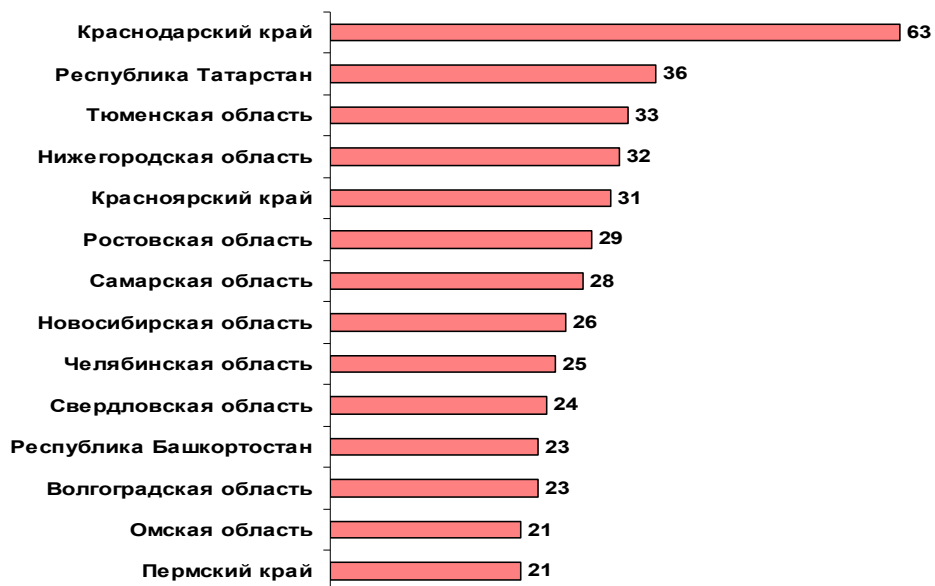
Рис. 6. Отношение инвестиций в основной капитал к ВРП 14 крупнейших регионов России

Анализ показателя отношения инвестиций к ВРП, который характеризует величину инвестиций, вложенных в каждый рубль ВРП, свидетельствует о сохранении тенденции «инвестиционных полюсов» (рис. 6). В числе наиболее обеспеченных находятся те же, благополучные регионы: Краснодарский край, Республика Татарстан, Тюменская область. Нижегородская область занимает 4 место, что является положительным фактором.