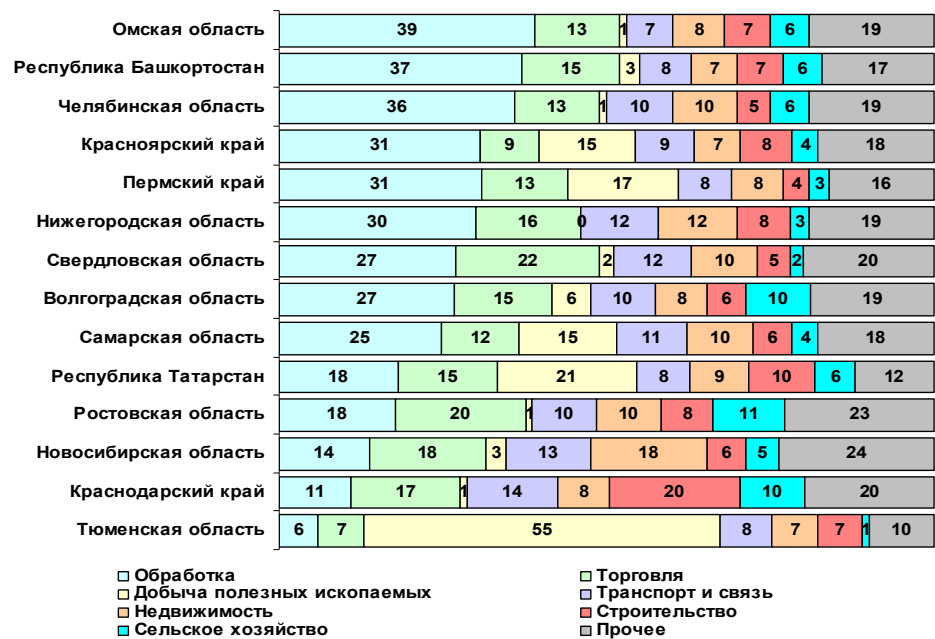
Рис. 3. Отраслевая структура валовой добавленной стоимости 14 крупнейших регионов России в 2012 году, %

Максимальное значение показателя наблюдалось у Нижегородской области (+4,2%), минимальное – в Челябинской области (+1,5%). Интересно наблюдать отраслевую структуру валовой добавленной стоимости, которая свидетельствует о динамике развития реального сектора экономики регионов (см. рис. 3).