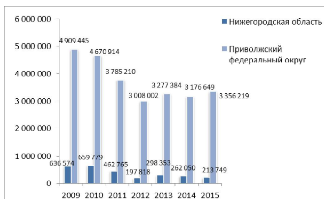
Рисунок 2. Динамика пассажирских перевозок речным транспортом в Приволжском федеральном округе и в Нижегородской области за 2009-2015 гг., человек.

В Нижегородской области объем пассажирских перевозок пока отстает от уровня предыдущих лет, хотя в 2015 году было перевезено 213,7 тыс.человек, что на 8 % превышает уровень 2012 года.