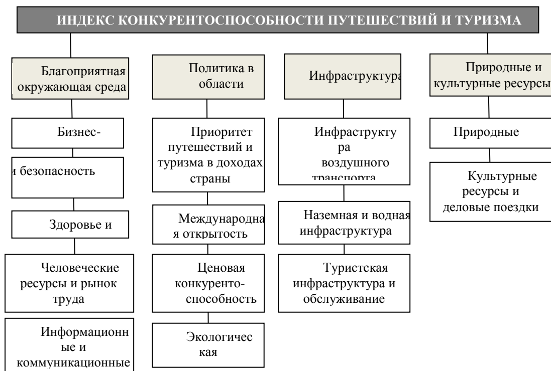
Рис.1. Структура показателей индекса конкурентоспособности сектора путешествий и туризма

Для того, чтобы оценить состояние транспортной обеспеченности туризма в России обратимся к Отчету конкурентоспособности путешествий и туризма (The Travel & Tourism Competitiveness Report), составляемый каждые два года Всемирным экономическим форумом. Как известно, структура индекса конкурентоспособности путешествий и туризма, публикуемого ВЭФ, основана на 14 критериях, объединённых в 4 подиндекса (начиная с 2015 г.): окружающая среда (5 критериев), политика в сфере туризма и путешествий (4 критерия), инфраструктура (3 критерия), природные ресурсы и культурное наследие (2 критерия) (рис. 1).