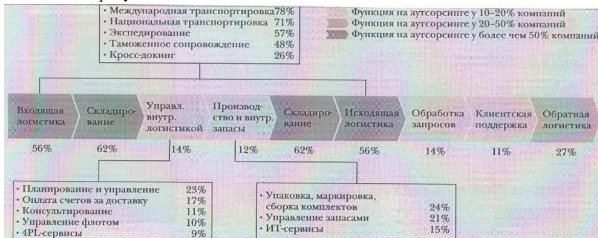
Рис. 1. Доля аутсорсинга по элементам логистики в мировой практике

По данным The Boston Consulting Group доля аутсорсинга транспортно-логистических услуг в России оценивается только в 20%, когда среднемировое значение составляет 40-50% 3 . Как распределяется аутсорсинг по элементам логистики в мире, представлено на рисунке 1.