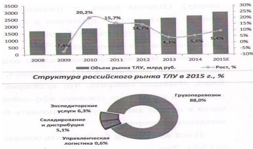
Рис. 2. Статистика российского рынка транспортно-логистических услуг

В связи с развитием логистического аутсорсинга количество посредников (провайдеров), которые предоставляют услуги в логистике, увеличивается с каждым годом.