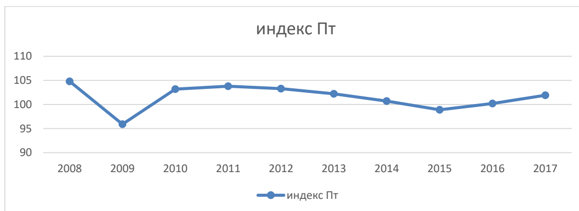
Рис.1. Индексы производительности труда (по состоянию на 15 марта 2019года) (в процентах к предыдущему году)

На рисунке 1 приведены данные индексов производительности труда в РФ с 2008 по 2017 гг. График показывает, что рост производительности труда наша экономика пока не демонстрирует. Тем более отсутствует 5-ти процентный рост, обозначенный Президентом как приоритетный. Это объясняется наличием нерешенных проблем в экономике: диспропорциями в ее структуре, низкой эффективностью использования ресурсов, сырьевой направленностью и др. Все эти факторы отрицательно сказываются на заработной плате – основном доходе населения.