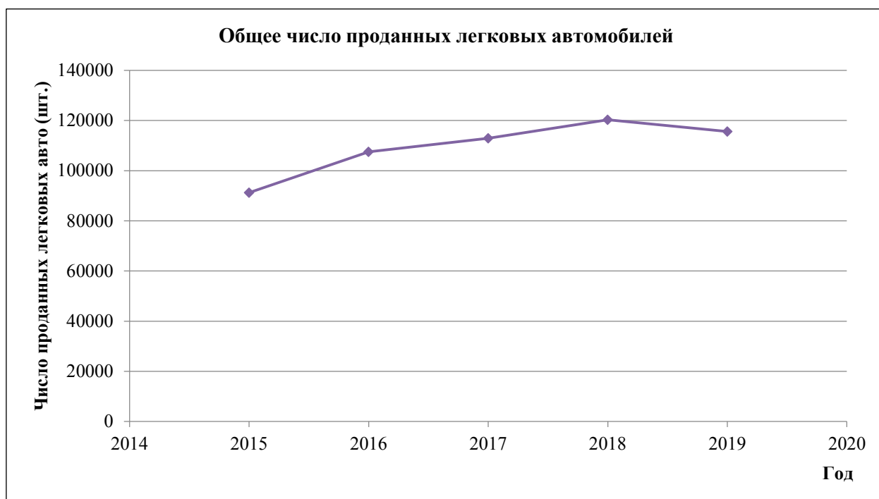
Рис. 1. Динамика продаж легковых автомобилей в Нижегородской области

Не является исключением и Нижегородская область, где отмечается динамика, характерная для РФ в целом. Общее число продаж легковых автомобилей в Нижнем Новгороде с 2015 по 2019 гг. представлено на рис. 1.