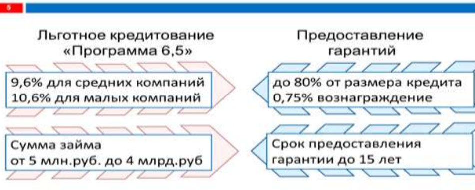
Рис.1. Льготное кредитование и предоставление гарантий

Минэкономразвития РФ совместно с АО «Корпорацией «МСП» разработала программу «1764» (Постановление Правительства РФ от 30.12.2018 № 1764), которая направлена на субсидирование банков, кредитующих малый и средний бизнес на льготных условиях — под 8,5% годовых, т.е. конечная ставка для субъектов МСП будет не выше 8,5% годовых; срок льготного кредита составит не более 10 лет – на инвестиционные цели и не более 3 лет – на оборотные цели. Суммарный объем кредитов для одного заемщика на инвестиционные цели составит 1 млрд. рублей и на пополнение оборотных средств – 100 млн. рублей. В Нижегородской области в 2019 году по программе "1764" было выдано более 5,8 млрд.рублей кредитов.