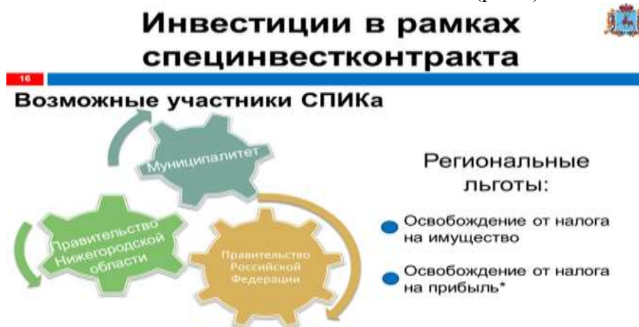
Рис.3. Инвестиции в рамках специального инвестиционного контракта

4. С 2017 года в Нижегородской области предоставляются налоговые преференции (льготы) в рамках специального инвестиционного контракта (СПИК). Ставка по налогу на прибыль и по налогу на имущество для таких инвесторов равна нулю. Инвестиции в проект должны составить не менее 750 млн. рублей, а доля выручки от реализации продукции, произведенной в соответствии со специальным инвестиционным контрактом, в общей доле выручки предприятия не менее 90%. В случае, если стороной по специальному инвестиционному контракту выступает муниципалитет, предприятия смогут претендовать на освобождение от земельного налога (рис.3).