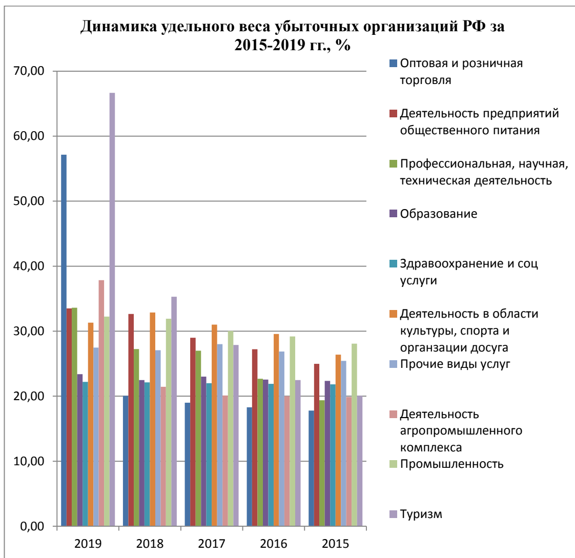
Рис.3. Динамика удельного веса убыточных организаций РФ за 2015-2019 гг., %

Далее рассмотрим динамику удельного веса убыточных транспортных предприятий за 2015-2019 гг. [5].