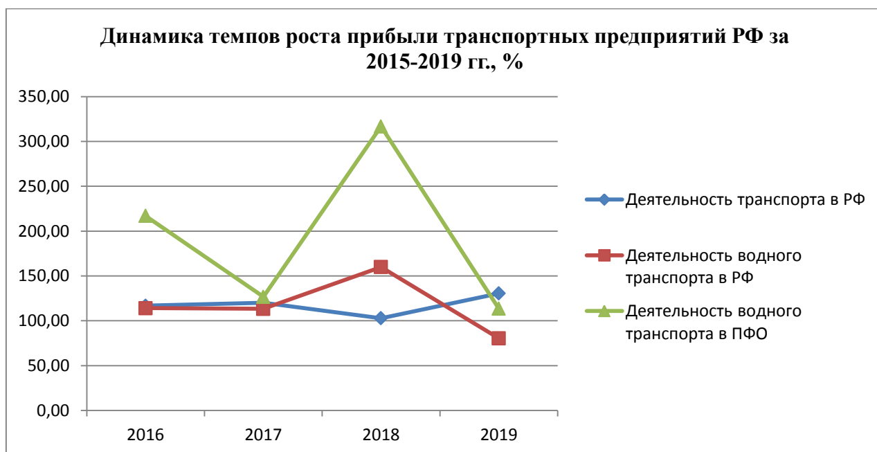
Рис.2. Динамика темпов роста прибыли транспортных предприятий РФ за 2015-2019 гг., %

На основании данных таблицы 2 был составлен график динамики темпов роста прибыли транспортных предприятий России за 2015-2019 гг. (Рис. 2).