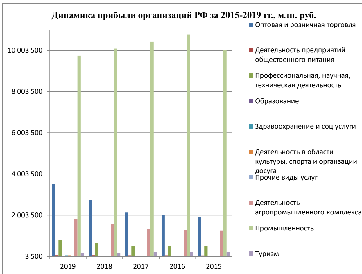
Рис.1. Динамика прибыли организаций РФ за 2015-2019 гг., млн. руб.

года. В 2019 году произошло снижение показателя на 1 088 млн. руб. На данное снижение могли повлиять как общеэкономические проблемы в стране, так и внутриотраслевые.