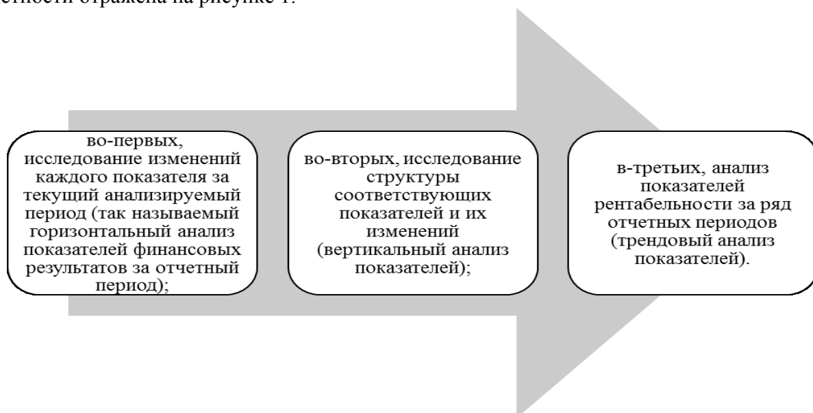
Рисунок 1 - Методология анализа прогноза экономической деятельности[6, с.575]

Методология анализа прогноза экономической деятельности посредством финансовой отчетности отражена на рисунке 1.