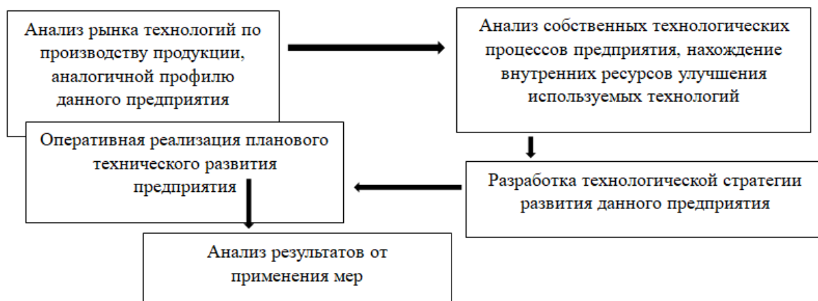
Рисунок 2 – Аспекты технико-технологической составляющей

Основное внимание направленно выстраивание оптимального рабочего производственного процесса так, чтобы минимизировать угрозы и риски или полностью свести их на нет. Основные аспекты, которые необходимы для технико-технологической составляющей (позиции):